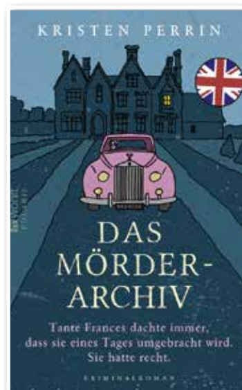
Kristen Perrin, Das Mörderarchiv, Kriminalroman, Rowohlt Verlag, 400 Seiten, Broschur, Preis 18 Euro