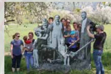
„Kirschkino“ im Geo-Naturpark „Frau-Holle-Land“

sen laden zum Verweilen ein. Witzenhausen ist übrigens mit ihrem Fachbereich Ökologische Agrarwissenschaften der Universität Kassel die kleinste Universitätsstadt und zeigt in ihrem Tropengewächshaus Kulturpflanzen aus aller Welt. In der Nähe von Witzenhausen befindet sich die Burg Ludwigstein und das Schloss Berlepsch im mittelalterlichen Ambiente. Von dort hat man eine herrliche Aussicht ins schöne Tal der Werra.