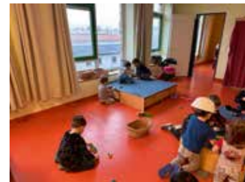
In der Baustube erlernen die Kinder kreatives Bauen.