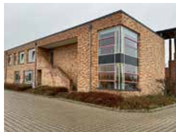
Außenansicht der DRK-Kita, Alter Holzhafen 29