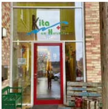
Herzliches Willkommen in der Kindertagesstätte am Holzhafen